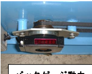
バックゲージ動力